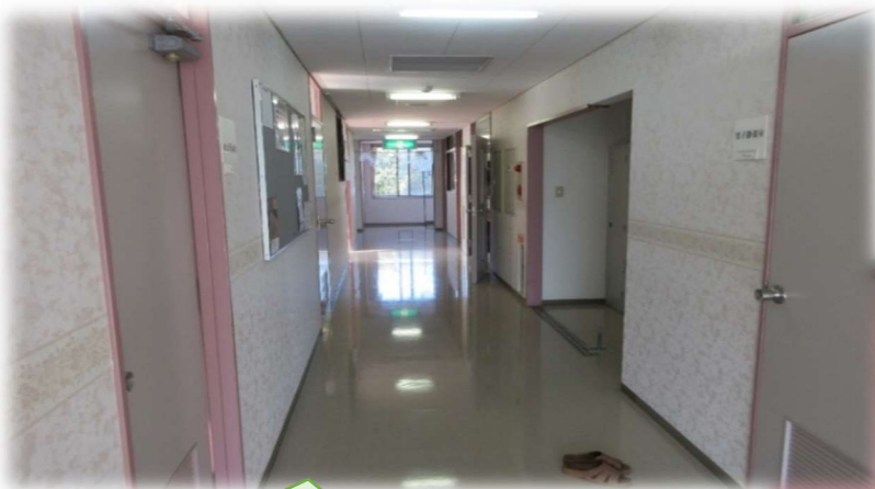
コースはなんと！廊下

仲間と協力して戦略的にゴールを目指したり、タッチ回数で得点王を目指したり と楽しいゲームです。