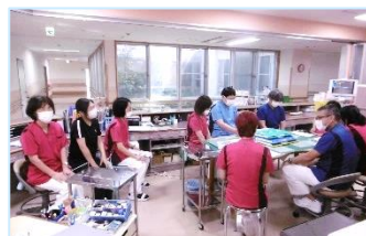
多職種によるチーム医療を全病棟で実践しています

なお、当院は予約制となっておりますが、認知症に限らず急激な症状悪化などで入院が必要と思われる場合は随時ご相談ください。可能な限り対応させていただきます。