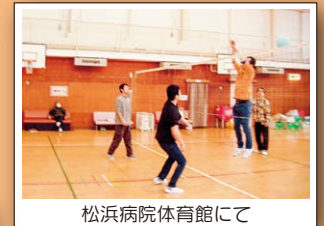
松浜病院体育館にて